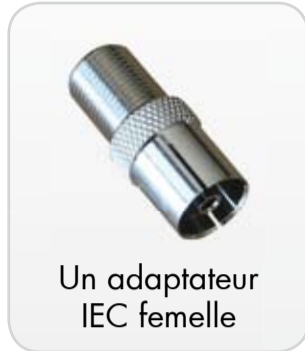
Un adaptateur IEC femelle