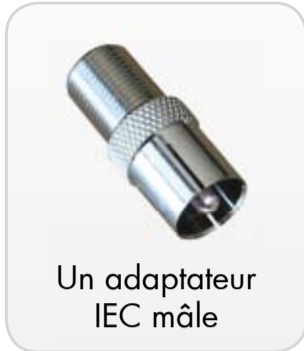
Un adaptateur IEC mâle