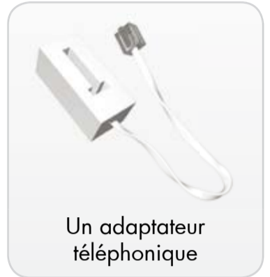
Un adaptateur téléphonique