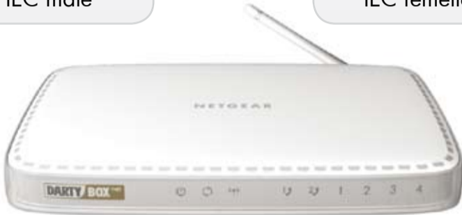
Une DartyBox THD