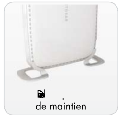
Un pied de maintien