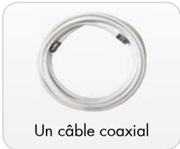
Un câble coaxial